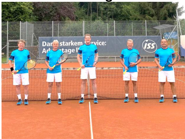
Leicht manipuliertes Mannschaftsfoto