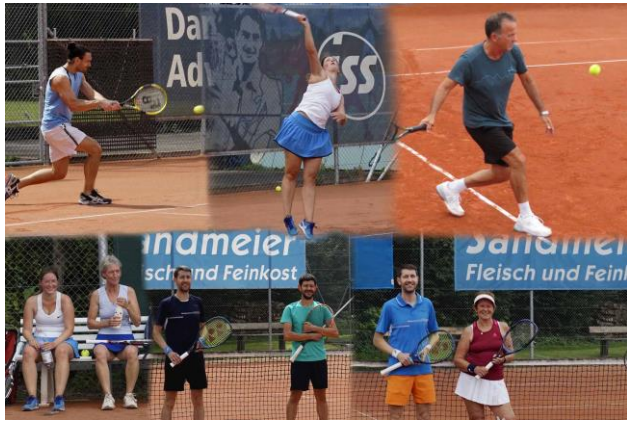
Unsere Clubmeister 2020

Weitere Fotos können auf unserer Homepage www.tc-muhen.ch/fotogalerie/2020 besichtigt werden.