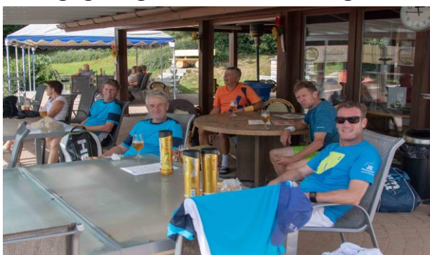
Vorbildlicher Corona-Abstand in Murgenthal