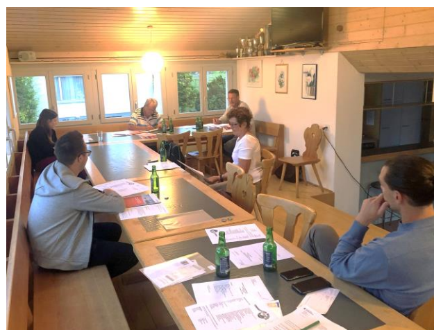
Coronakonforme Sitzung des Vorstandes

Herzlichen Dank für euer Verständnis. Wir hoffen und freuen uns mit euch, dass dieser beliebte Anlass nächstes Jahr wieder möglich sein wird.